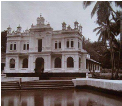
ක්‍රි.ව.920 මුලින්ම ඉදිකරන ලද ලංකාවේ මුල්ම මුස්ලිම් පල්ලිය ලෙසට සැලකෙන බේරුවල මස්ජිද් අබ්දාල් (මරදාන) පල්ලිය

“තමා සිටි කාලයේ බේරුවල පදිංචි වී සිටි ඉතාම පැරණි මුස්ලිම් පවුල් වලින් එකක් සතුව පැවති පුරාණ අරාබි ලේඛනයක්, 1926 දී ලියන ලද “සෝනහාර්” නම් වූ සිය කෘතියෙහි ජේ. සී. වැන් සැන්ඩන් උපුටා දක්වයි. එහි දැක්වෙන පරිදි, යේමනයේ රජ පවුලකට අයත් පුතුන් දෙදෙනෙකු ක්‍රි.ව 604 දී ලංකාවට පැමිණ ඇත. ඉන් එක් තැනැත්තෙක් මන්නාරමට ගොඩ බැස අතර අනෙක් තැනැත්තා බේරුවල ගොඩ බැස එහි පදිංචි වී ඇත. ඔහුගෙන් පැවතෙන්නන් බැව් කියා පෑ මුස්ලිම්වරු කිහිප දෙනෙක්ම බේරුවල සිටියහ.”