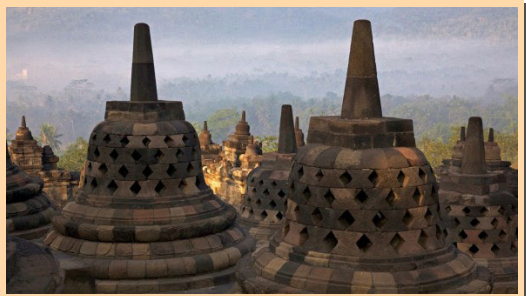
දැනටත් ලෝක උරුමයක් ලෙස පැවතෙන ඉන්දුනීසියාවේ බොරෝ බුදුර් විහාරය

එලෙසම මුස්ලිම් ව්‍යාපාරිකයින් පිළිබඳවත් මෙම රජවරුන් අතරේ උසස් පිළිගැනීමක් තිබූ හෙයින් තම කුමාරිකාවන්ව ඔවුන්ට සරණ පාචා දෙන්නට ඉදිරිපත් වී ඇත. ඉහතින් සඳහන් කළාක් මෙන් පාලකයින් අතර ඇති වූ මෙම ආගමික වෙනස රට වැසියන් කෙරෙහි ද බලපෑමක් ඇති කළාට කිසිම සැකයක් නොමැත. මෙවන් කරුණු හැරෙන්නට ඉන්දුනීසියාව ආක්‍රමණය කරන්නට පැමිණි මුස්ලිම් හමුදාවක් පිළිබඳව ඉතිහාසයේ කිසිම සඳහනක් නොමැත. අසිපතක හෝ අන් බලපෑමකින් තොරව ඉස්ලාමය ඉන්දුනීසියාවේ පැතිර ගිය ද එරට බෞද්ධ හා හින්දු ආගමික ස්ථානයන් ආරක්ෂා කිරීමට ඔවුන් ක්‍රියා කොට ඇත.