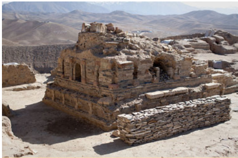
ඇතට ලෝක උරුමයක් ලෙස පැවැතෙන අැර්ගනිස්තානයේ මෙස් අයනක් ස්ථූපය

තබ් තුමාගේ ඇවෑමෙන් පසු අරාබි කරය පාලනය කළ පාලකයින් විසින් ලොව අන් පාලකයින් සිය පාලනය ව්‍යාප්ත කළ ස්වරූපයෙන්ම තම පාලනය ව්‍යාප්ත කිරීම සඳහා ලෝකයේ විවිධ රටවලට ගොස් ඇත. එලෙසම අැර්ගනිස්තානය ආශ්‍රිත ප්‍රදේශ වලටද මොවුන් අවතීර්ණ වී ඇත. එහි දී ඔවුන් එම රටවල ක්‍රියාත්මක කළ ඉස්ලාමීය රාජ්‍ය පාලන ක්‍රමයේ සාධනීය ලක්ෂණ කෙරෙහි පැහැදිලිව රටවැසියා ක්‍රමයෙන් සිය කැමැත්තෙන් ඉස්ලාමය වැළඳ ගත්හ. නමුත් පාලනය කළ මුස්ලිම්වරුන් එහි වැසියන් ව බලහත්කාරයෙන් ඉස්ලාමයට හරවා ගැනීමේ ක්‍රියාවක නියැලුණු බවට ඓතිහාසික අව්‍යාජ සාක්ෂි කිසිවක් අප දන්නා තරමින් නොමැත. ඇයිදයත් එසේ කිරීමට ඉස්ලාමීය ඉගැන්වීම් තුළ කිසිම අනුමැතියක් නොමැති හෙයිනි. අැර්ගනිස්තානය පාලනය කළ මුස්ලිම්වරුන් එහි වැසියන්ට තම දහම නිදහසේ පිළිපදින්නට අවශ්‍ය පූර්ණ නිදහස ලබා දී තිබූ බව ඓතිහාසික තොරතුරු දන්වා සිටී.