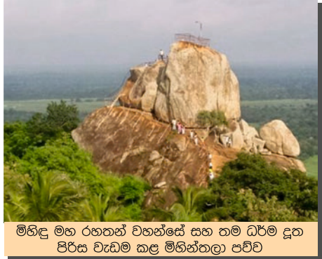
මිහිඳු මහ රහතන් වහන්සේ සහ තම ධර්ම දූත පිරිස වැඩම කළ මිහින්තලා පව්ව

‘අශෝක සිරිත’ට අනුව කාලිංග යුද ජයග්‍රහණයෙන් ලත් අත්දැකීම් ඔස්සේ බුදු දහම වැළඳගත් ධර්මාශෝක රජු විසින් බෞද්ධ ධර්ම දැක්වීමේ වහන්සේලා විදේශීය රටවල් රාශියකට බුදු දහම ප්‍රචාරය කිරීම සඳහා පිටත් කර හැරීම සිදු කරන ලදී. එසේ යැවූ රටවල් අතර ශ්‍රී ලංකාව ද එකකි.