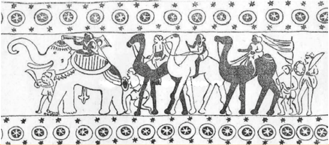
පෘතුගීසීන්ට විරෙහිව පෙළ ගැසුනු කාන්තණ්කඩ ප්‍රදේශයේ යෝනකවරුන්ගෙන් සැදුම් ලත් ශුද්‍ර හමුදාව දැක්වෙන පැරණි සිතුවමක්

ඉහත සියලු කරුණු සමස්තයක් වශයෙන් සමාලෝචනය කර බැලීමේ දී ඉස්ලාමය බලෙන් ව්‍යාප්ත කරන ලද්දක් නොවන බව මධ්‍යස්ථ ඕනෑම අයෙකුට ඉතාම පැහැදිලිව අවබෝධ කර ගත හැක්කක් බව විශ්වාස කරන්නෙමු. එනිසා ශ්‍රී ලංකාව ඉස්ලාමීය රටක් බවට පත් කර වන්නට කිසිදු ආකාරයක රහසි ගත කුමන්ත්‍රණයක අප නොමැති බව අවධාරණයෙන් යුක්තව පවසන්නට කැමැත්තෙමු.