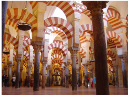
දැනට ලෝක උරුමයක්ව පවතින ස්පාඤ්ඤයේ කොර්ඩොබා මුස්ලිම් දේවස්ථානය

මුස්ලිම්වරුන් ස්පාඤ්ඤය අවුරුදු 800 ක් පාලනය කළහ. මෙම දීර්ඝ කාලය තුළ අසිපත යොදා ගත්තේ නම් සම්පූර්ණ ස්පාඤ්ඤ වැසියන්ම ඉස්ලාමිකයින් වී තිබිය යුතුය. පසු කාලීනව කුරුස යුදකාමීන් විසින් මුස්ලිම්වරුන් ව ස්පාඤ්ඤයෙන් සම්පූර්ණයෙන්ම පලවා හරින ලදී. මුස්ලිම් පාලකයින් අසිපතින් ආගමික හරවා ගැනීම් නොකළ බවට මෙය පැහැදිලි ඓතිහාසික සාක්ෂියක් නොවන්නේ ද?