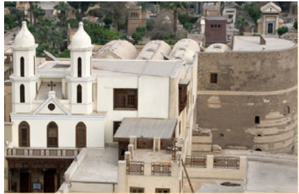
ක්‍රි.ව. 690 සිට අද වන තෙක් ඊජිප්තුවේ කයිරෝ නුවර සුරක්ෂිතව පැවැතෙන (Hanging Church) කොප්ටික් ක්‍රිස්තියානි දේවස්ථානය

ඉස්ලාමය බිහි වූ අරාබි කරයේ අරාබිවරුන් අතර ආරම්භයේ සිට අද දක්වා මිලියන 14 ක් පමණ වූ කොප්ටික් අරාබි කිතුනුවන් ජීවත් වෙති. අසිපත එදත් අදත් ඉස්ලාමයේ ප්‍රචාරක අවියක් වූවා නම් මෙම අරාබි කොප්ටික් කිතුනුවන් ආරම්භයේ සිට අද දක්වා ඉස්ලාමීය අරාබි කරයේ කෙසේ නම් ආරක්ෂා සහිතව ජීවත් විය හැකි වන්නේ ද? ජාත්‍යන්තර මාධ්‍ය අපට නිරතුරුව ගෙන හැර දක්වන්නේ මෙයට හාත්පසින්ම ප්‍රති විරුද්ධ තොරතුරුය. මෙයට ප්‍රධාන හේතුව බටහිර මාධ්‍ය සහමුලින්ම අයිති වී ඇත්තේ ඉස්ලාම් විරුද්ධ යුදෙව්වන්ට වීමයි. මේ හේතුව නිසාම බටහිර මාධ්‍ය විසින් සෑම විටම ඉදිරිපත් කරනුයේ ඉස්ලාම් විරෝධී ප්‍රචාරයන්ය.