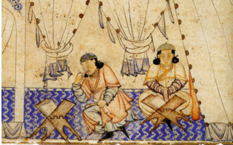
මොන්ගෝලියන් කුමරුන් අල්-කුර්ආනය ඉගෙන ගන්නා අයුරු දැක්වෙන සිතුවමක්

කුමාරයින් තමන්ගේ අමාත්‍ය මණ්ඩලයට හා නිලධාරීන්ට ඉස්ලාමය වැළඳ ගන්නා ලෙස ආරාධනා කළ අවස්ථාවේ සැවොම විමතියට පත්කරමින් හෙළිදරවු වූ කරුණක් වූයේ ඔවුන්ගෙන් බහුතරයක් ඒ වනවිටත් රහසිගතව ඉස්ලාමය වැළඳ ගෙන සිටීමය. රජවාසලින් කරන ලද ප්‍රසිද්ධ නිවේදනයකින් පසුව මොන්ගෝලියානු සන්නද්ධ හමුදා සාමාජිකයින් මෙන්ම සිවිල් වැසියන් ද දහස් ගණනින් ඉස්ලාමය වැළඳ ගන්නා ලදී. එදින මොන්ගෝලියානු අධිරාජ්‍යය උත්සවශ්‍රීයෙන් ඉතිරිගිය දිනයක් විය. සියළුම මුස්ලිම් සිරකරුවන් ව නිදහස් කරන ලදී. ඉස්ලාමීය රජයන් මත අති හයානක හිෂණයක් මුදා හරිමින් එම රටවල් තමන්ගේ යටත් විජිත බවට පත් කර ගත් මොන්ගෝලියානු අධිරාජ්‍යයේ විශාල පිරිසක් ඉස්ලාමය වැළඳ ගැනීමට හේතු වූයේ මුස්ලිම්වරුන්ගේ ශ්‍රේෂ්ඨ වර්යාවන් මිස අසිපත නොවන බව මෙයින් පැහැදිලිවනු ඇතැයි විශ්වාස කරන්නෙහු.