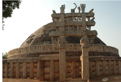
ඉන්දියාවේ අගේක රජුගේ පාලන යුගයේ ඉදිකරන ලද මුස්ලිම් පාලන යුගයේ සුරක්ෂිතව තිබූ යුනිස්කෝ ලෝක උරුමයක් වන සන්චි ස්ථූපය

අවුරුදු දහසක් පමණ මුස්ලිම් වරුන් ඉන්දියාව පාලනය කළහ. අදත් එම රටේ ජනගහනයෙන් 80%ක් මුස්ලිම් නොවන්නන් වීම අසිපත ඉස්ලාමයේ ආගම් ප්‍රචාරක අවියක් නොවූ බවට සාක්ෂියක් නොවන්නේ ද? කරුණාකර සිතා බලන්න.