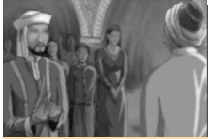
ශ්‍රී ත්‍රිබුවන අදින්යා රජු ඉස්ලාම් දහම වැළඳ ගැනීම දැක්වෙන ප්‍රකට සිතුවමක්

පළමුව බෞද්ධ රටක් ව පැවති මාලදිවයින ඉස්ලාමය වැළඳ ගත්තේ කෙසේද යන්න ඓතිහාසික තොරතුරු පදනම් කරගෙන විමසා බලමු.