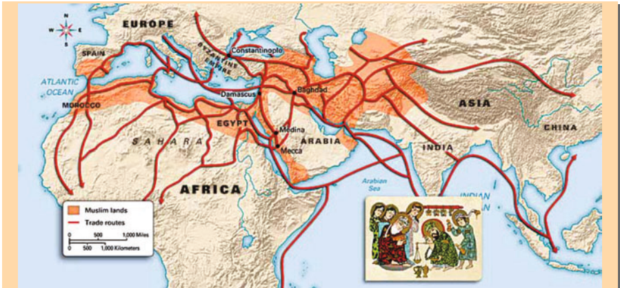
ක්‍රි.ව. 1200-1600 කාල පරාසය තුළ මුස්ලිම් වරුන්ගේ වෙළඳ ජාලයේ ව්‍යාප්තිය දැක්වෙන සිතියමක්

අරාබි ජාතිකයින් අතීතයේ ජාත්‍යන්තර ව්‍යාපාරික හා නාවික කටයුතු පිළිබඳව ප්‍රසිද්ධියට පත්ව සිටියහ. තම ව්‍යාපාරික කටයුතු ඉතාම අවංක ලෙස ඉටු කිරීම හේතුවෙන් ඔවුන් සමඟ ගනුදෙනු කළ විවිධ රටවල්වල පාලකයින් හා ජනයා ඔවුන් ගැන මනා පැහැදීමකින් යුක්ත වූහ. මෙම අරාබි ජාතිකයින් වෙළඳාමට අමතරව වෛද්‍ය විද්‍යාව, යුද උපදේශක කටයුතු, රාජ්‍යතාන්ත්‍රික කටයුතු ආදියෙහි නිපුණතාවන් තිබූ අය වූහ. ඔවුන් පිළිබඳව අමතර පැහැදීමක් ඇති වීමට මෙම කරුණු ද හේතු වී ඇති බව පෙනෙන්නට ඇත. ශ්‍රී ලංකාවට ඉස්ලාමය පැමිණීමේ ජාත්‍යන්තර වෙළඳාම හේතුවෙන් බව අප කවුරුන් දන්නා කරුණකි. අරාබි වෙළඳුන්ගේ අවංකකම මෙන්ම ඔවුන්ගේ අනෙකුත් හැකියාවන් ගැන පැහැදුණු සිංහල රජ දරුවන් ඔවුන්ට සිංහල කාන්තාවන් විවාහ කර ගැනීමට අවසරය ලබා දී මෙරටේ පදිංචි කරවා ගැනීමට කටයුතු කළ බව ඉතිහාසය අපට පැහැදිලි කරයි. මේ පිළිබඳව ඇති ඓතිහාසික තොරතුරු කිහිපහක් පහතින් දක්වා ඇත්තෙමු.